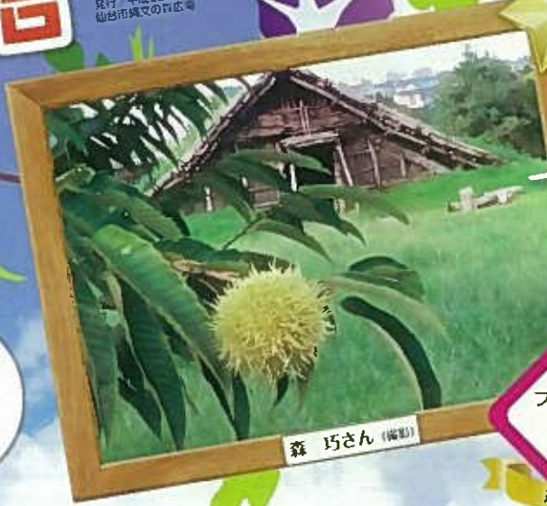
森 巧さん (編製)

2015年5月～12月にかけて、地底の森ミュージアム・縄文の森広場の野外展示の写真を募集したミュージアムフォトコンテスト。その中から、縄文の森賞を受賞した作品を紹介합니다。