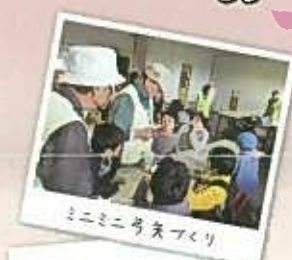
ミニミニ弓矢づくり

毎年恒例。今年も5月5日のこどもの日に縄文春まつりが開催されました。当日はGWの中でも特に風が強い日となってしまいましたが、たくさんのお客様にご来場いただきました!! 縄文ファッションや縄文食の試食体験、工作体験のミニミニ弓矢づくりなど春まつり限定のイベントが行われました。ご来場いただいたみなさまありがとうございました。