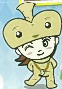
貝のアクセサリーづくり