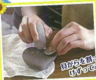
貝殻を割って けずってみがいて...